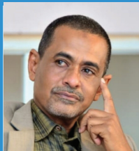
د. عصام بطران يكتب